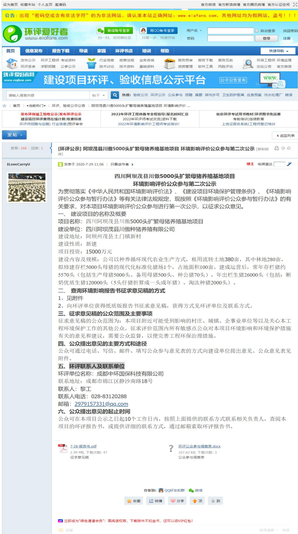
图 3-1 第二次网络公示截图