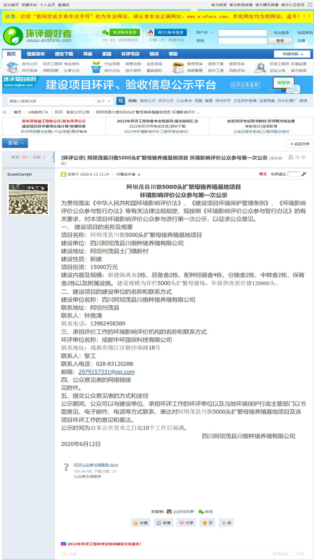
图2.1 第一次网络公示截图